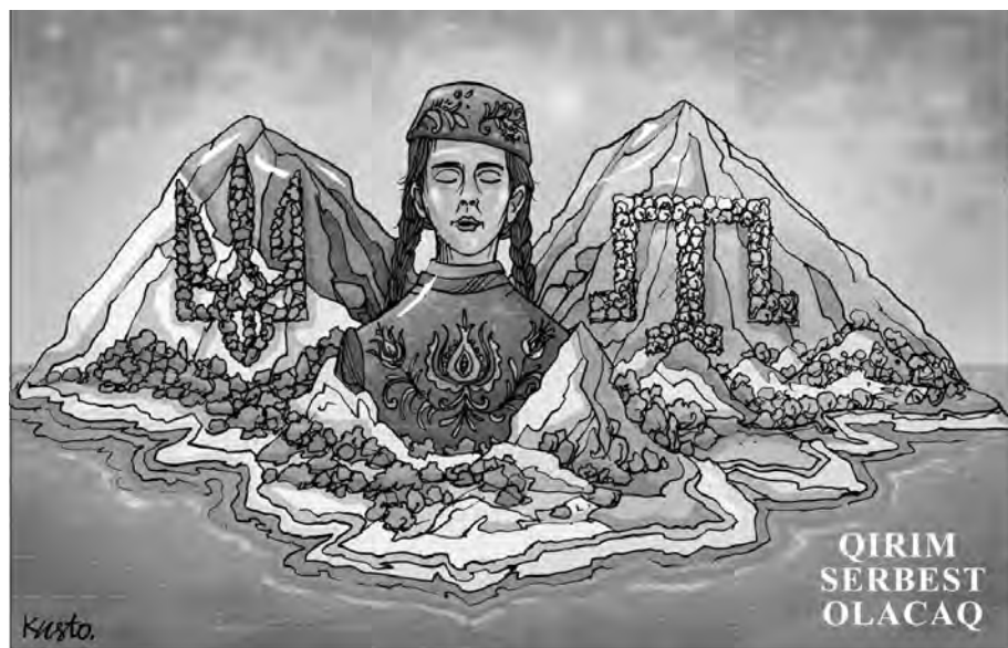
Крим буде вільним.