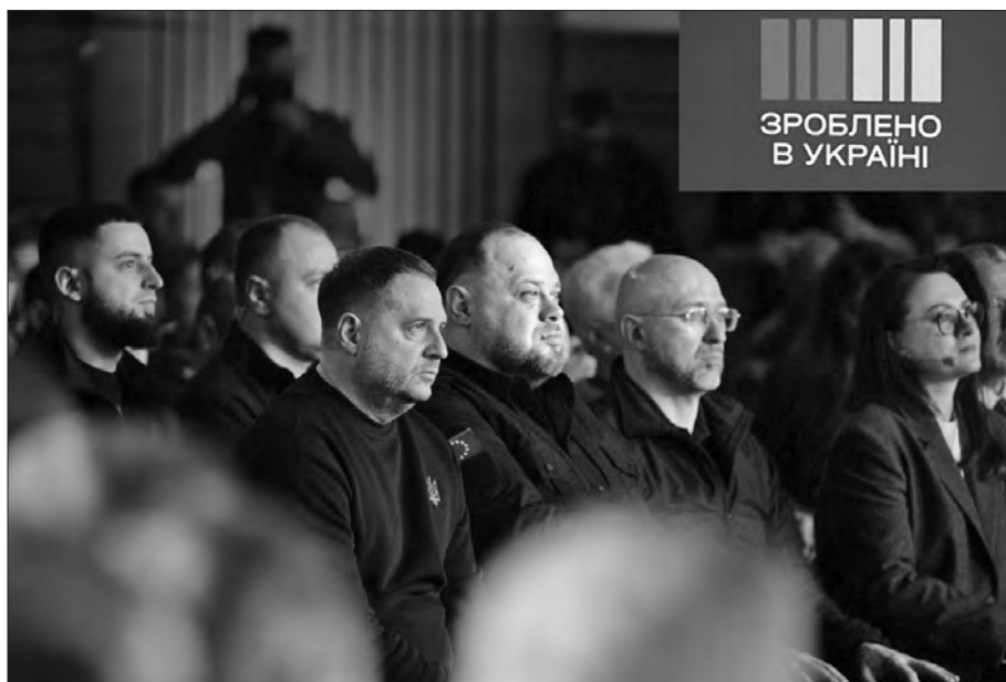
Під час форуму.

«Я радий оголосити про старт нашої нової економічної платформи, а отже, нової економічної політики — політики Made in Ukraine, політики «Зроблено в Україні», — сказав Президент, зауваживши: щоб Україна мала весь необхідний ресурс для своєї Перемоги, мають перематати також українські товари, українські послуги, українське споживання та український експорт, тобто українські підприємці.